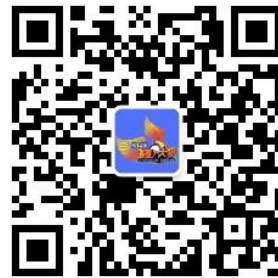
全国 3D 大赛微信公众号

全国三维数字化创新设计大赛组委会 国家制造业信息化培训中心 全国 3D 技术推广服务与教育培训联盟(3D 动力) 光华设计发展基金会 2024 年 3 月