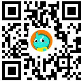
新灵兽实验室平台

官方网站：年度竞赛： https://3dds.3ddl.net/ 精英联赛： https://ds.3ddl.net